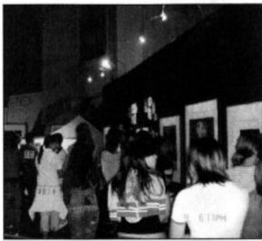
Studenti in visita alla mostra dedicata a Picasso

La mostra dedicata a Picasso - che si è snodata tra la Pinacoteca comunale e la chiesa di Sant'Agostino, nella Città Alta - ha completato un tritico che Civitanova ha dedicato agli artisti contemporanei. Nei due anni precedenti sono state infatti organizzate esposizioni dedicate a Andy Warhol e Salvador Dalì.