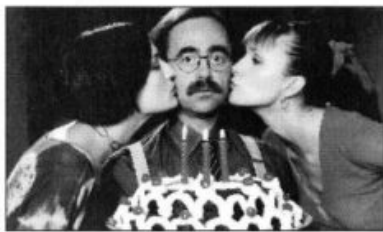
Maurizio Nichetti, regista cinematografico con incursioni nella prosa e nella lirica, è anche il regista delle "Sorelle Materassi". A destra le protagoniste